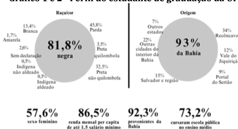
Gráfico 1 e 2 - Perfil do estudante de graduação da UFRB

A autodeclaração dos discentes da instituição é de 81,8% Negros, 48,8% Pardos, 3,5% Pretos Quilombolas, 32,5% Pretos Não-Quilombolas, 13,4% Brancos, 1,7% Amarelos, 2,5% sem autodeclaração, 0,3% Indígenas não aldeados e 0,3% Indígenas aldeados. A renda mensal per capita de até 1,5 salários-mínimos é correspondente a 86,5% desses estudantes e 73,2% cursaram escola pública no Ensino Médio.